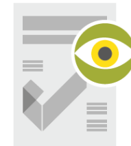
Steigerung der Sichtbarkeit von OJS-Journals.